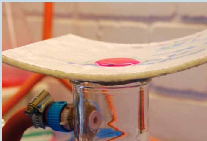
Contrôle d'étanchéité : gaine imperméable