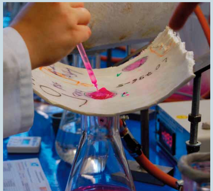
Contrôle d'étanchéité : de l'eau teintée en rouge est répandue sur la surface intérieure de la gaine