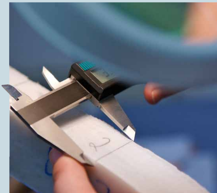
L'épaisseur de paroi d'une gaine est mesurée avec un pied à coulisse de précision