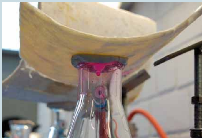
Contrôle d'étanchéité : gaine perméable