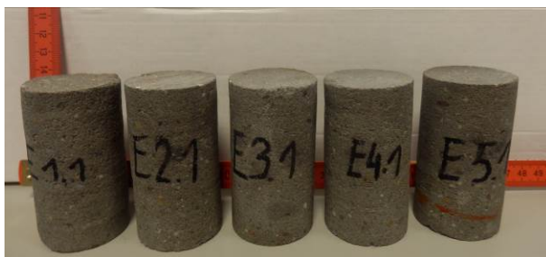
A: Zylindrische Probekörper aus dem Gerinne-Estrich

Abb. 5 zeigt beispielhaft einige zylindrische Probekörper aus dem Fugen-Estrich (Abb. 5A) und dem Hochleistungsbeton SWHB (Abb. 5B) vor Beginn der Einlagerung.