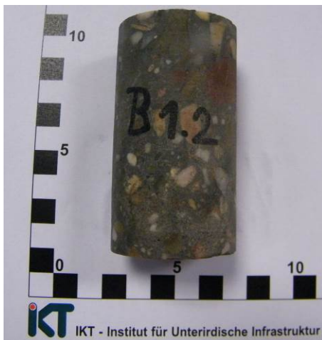
A: Wassergelagerter Probekörper (Hochleistungsbeton SWHB)