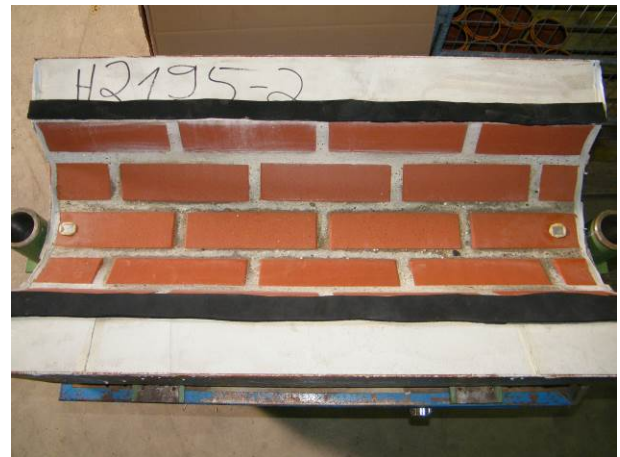
B: Gerinne aus Mauerwerk (Klinker und Fugenmörtel)