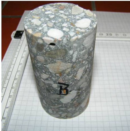
A: Wassergelagerter Probekörper (Hochleistungsbeton SWHB)