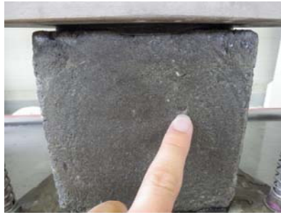
B: Probekörper 2 mit Wasseraustritt aus der Seitenwand oberhalb der Fingerspitze nach ca. 5 min Prüfzeit