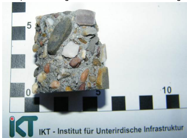
B: Probekörper für die Druckfestigkeitsprüfung (Hochleistungsbeton SWHB nach Säurelagerung)