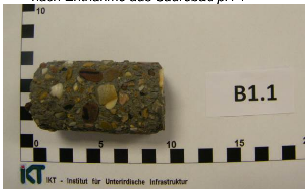
E: Abgebürsteter Probekörper (Hochleistungsbeton SWHB)