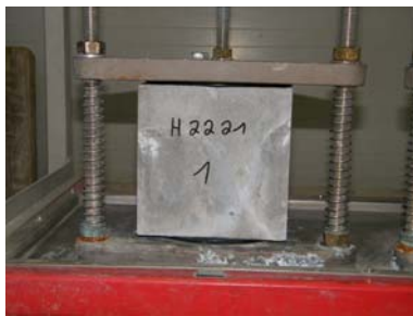
A: Probekörper 1 während der Prüfung

Die Wassereindringprüfung wird gemäß DIN EN 12390-8 [7] an Materialproben aus dem Hochleistungsbeton SWHB und dem Fugen-Estrich, der für die Schachtunterteile mit geklinkertem Gerinne verwendet wird, durchgeführt. Die Probekörper werden über eine Zeitdauer von 72 Stunden in die Prüfvorrichtung eingespannt (Abb. 11A bis C) und mit einem Wasserdruck von 5 bar beaufschlagt. Nach Ablauf der Prüfzeit werden die Probekörper ausgebaut, gespalten (Abb. 11D bis F) und die Wassereindringtiefe an den Bruchflächen visuell ermittelt. Nach Spaltung der Proben zeigte sich allerdings, dass an dem Hochleistungsbeton SWHB ein Wassereindrang visuell und messtechnisch nicht erfasst werden konnte.