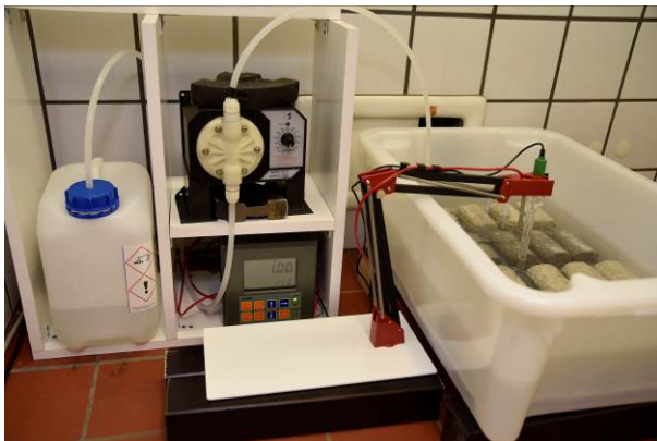
A: Schwefelsäurebad mit rechnergesteuerter Titrationsanlage

Die jeweils fünf zylindrischen Probekörper aus dem Hochleistungsbeton SWHB und dem Fugen-Estrich liegen zusammen mit den jeweils fünf Prismen und Zylindern aus dem Referenzmörtel in einem Behälter mit Schwefelsäure pH 1. Der pH-Wert des Bades wird durch eine rechnergesteuerte Titrationsanlage konstant auf \text{pH } 1 \pm 0,03 gehalten (vgl. Abb. 8). Die Lösung wurde während der 70-tägigen Einlagerungsdauer wöchentlich gewechselt.