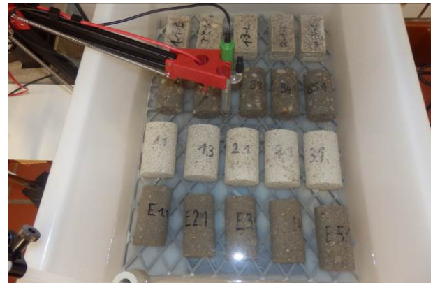
B: Lagerung der Probekörper im Säurebad