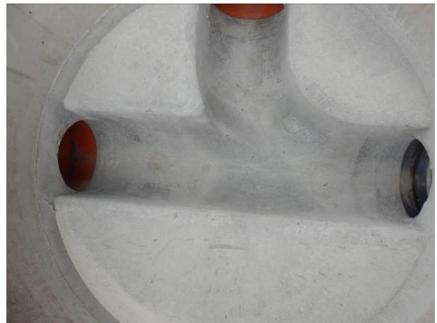
B: Ausführung des Schachtunterteils aus Hochleistungs-Monolithbeton SWHB mit drei Rohranschlüssen