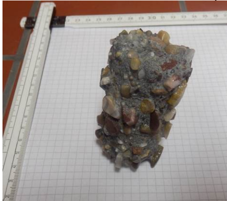
E: Abgebürsteter Probekörper (Hochleistungsbeton SWHB)