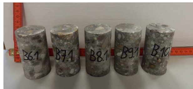
B: Zylindrische Probekörper aus dem Hochleistungsbeton SWHB