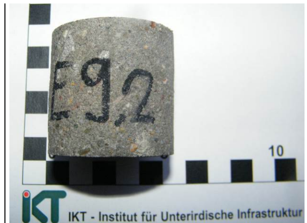
C: Probekörper für die Druckfestigkeitsprüfung (Fugen-Estrich nach Wasserlagerung)