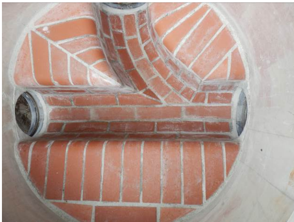
A: Ausführung des Schachtunterteils aus Mauerwerk mit drei Rohranschlüssen