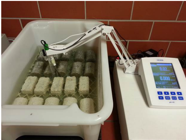
A: Tägliche Kontrollmessung der Schwefelsäure pH 0