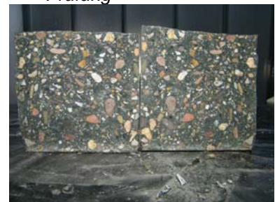
F: Probekörper 3 ohne erkennbaren Wassereindrang