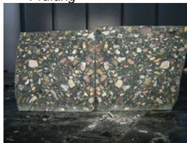
E: Probekörper 2 ohne erkennbaren Wassereindrang