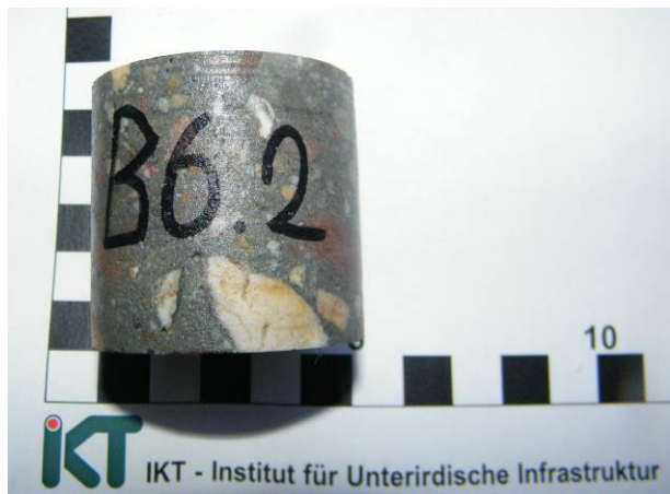
A: Probekörper für die Druckfestigkeitsprüfung (Hochleistungsbeton SWHB nach Wasserlagerung)

Die säuregelagerten Proben sowie die zugehörigen, wassergelagerten Referenzproben werden am selben Tag aus der Bad entnommen und in Anlehnung an DIN EN 196-1 [6] auf Druckfestigkeit geprüft. Als Vorbereitung für die Druckfestigkeitsprüfungen wurden die Probekörper zunächst mit einer weichen Messing-Handbürste unter Wasser von losen Bestandteilen befreit. Anschließend wurden die Prismen und Zylinder (vgl. Abb. 10) mittig aus den jeweiligen Probekörpern herausgesägt und die Schnittflächen für die Krafteinleitung planparallel geschliffen.