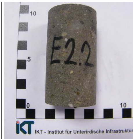
B: Wassergelagerter Probekörper (Fugen-Estrich)