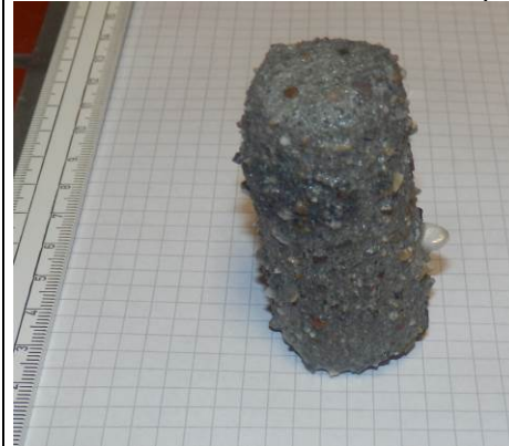
F: Abgebürsteter Probekörper (Fugen-Estrich)