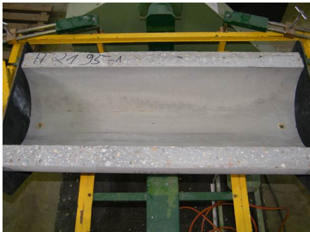
A: Rohrhalbschale aus Hochleistungsbeton SWHB

Die Beständigkeit von Werkstoffen für den Einsatz in Kanalisationen gegenüber Abrieb wird heute üblicherweise mit der Abriebprüfung in der Darmstädter Kiprinne nach DIN EN 295-3 [4] untersucht. Um diese Prüfung durchführen zu können, stellten Mitarbeiter des AG ein Meter lange Halbschalen DN 300 aus Hochleistungsbeton SWHB und aus dem Mauerwerk der geklinkerten Gerinne her (vgl. Abb. 2).