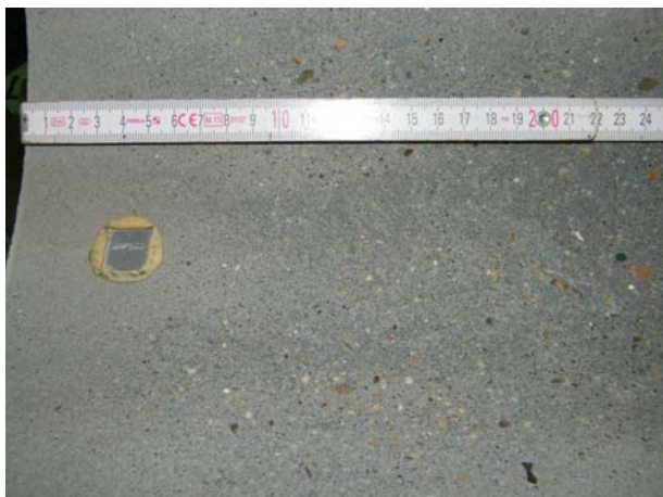
A: Abrieb im Randbereich der Rohrhalbschale

Als Ergebnis des Abriebversuches gilt die mittlere Eintiefung a_m nach 100.000 Lastwechseln gegenüber dem 1 Ursprungszustand. Abb. 3 zeigt exemplarisch die Oberfläche des Hochleistungsbetons SWHB nach dem Abriebversuch. Der Randbereich der Halbschale (Bild A) weist eine vergleichsweise glatte Oberfläche auf, während im mittleren Bereich der Halbschale (Bild B) der Abrieb durch Freiliegen des oberflächennahen Zuschlags erkennbar ist.