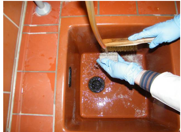
B: Abbürsten eines Probekörpers nach Entnahme aus dem Säurebad