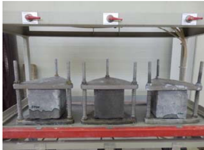
A: Probekörper in der Prüfeinrichtung

ring, so dass Wasser sehr schnell durch den Fugen-Estrich bis zur seitlichen Oberfläche des Würfels gelangen konnte. Die Prüfung musste daraufhin abgebrochen werden.