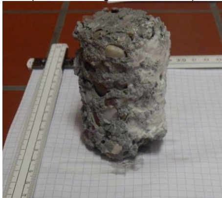
C: Probekörper (Hochleistungsbeton SWHB) nach Entnahme aus Säurebad pH 0