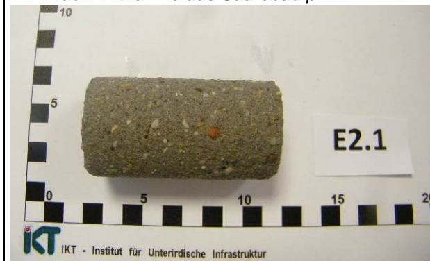
F: Abgebürsteter Probekörper (Fugen-Estrich)