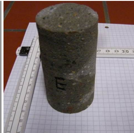
B: Wassergelagerter Probekörper (Fugen-Estrich)