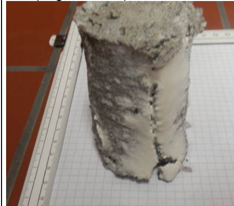
D: Probekörper (Fugen-Estrich) nach Entnahme aus Säurebad pH 0