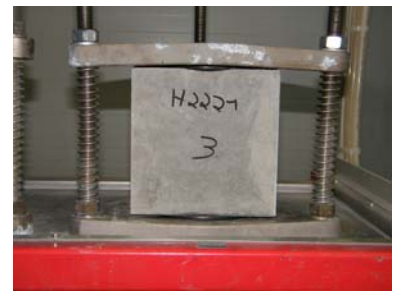
C: Probekörper 3 während der Prüfung