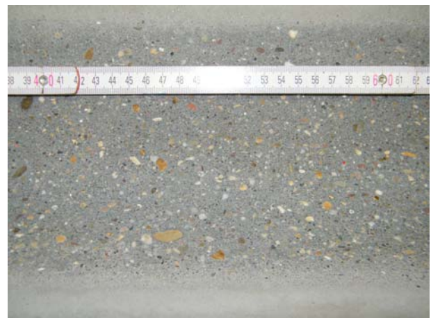
B: Abrieb in der stärker beanspruchten Mitte der Halbschale