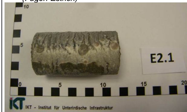
D: Probekörper (Fugen-Estrich) nach Entnahme aus Säurebad pH 1