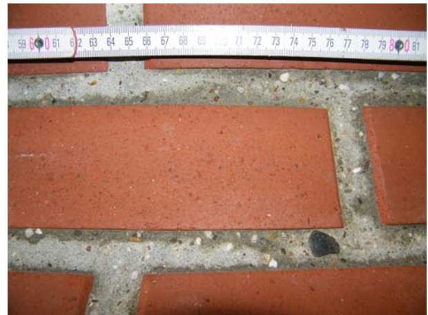
B: Abrieb in der stärker beanspruchten Mitte der Halbschale