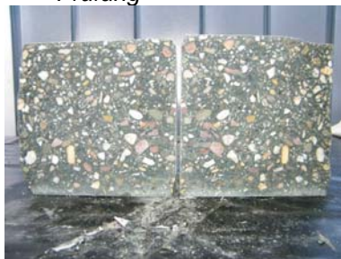
D: Probekörper 1 ohne erkennbaren Wassereindrang