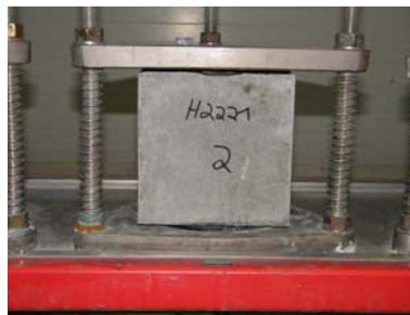
B: Probekörper 2 während der Prüfung