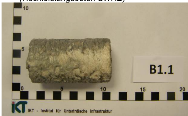
C: Probekörper (Hochleistungsbeton SWHB) nach Entnahme aus Säurebad pH 1