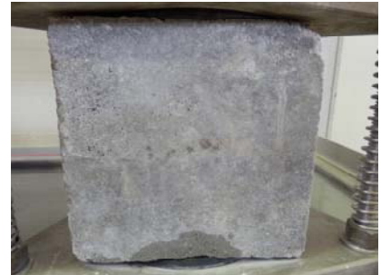
C: Probekörper 3 mit sichtbarem Feuchtigkeitsaustritt an der Außenseite nach ca. 2 min Prüfzeit