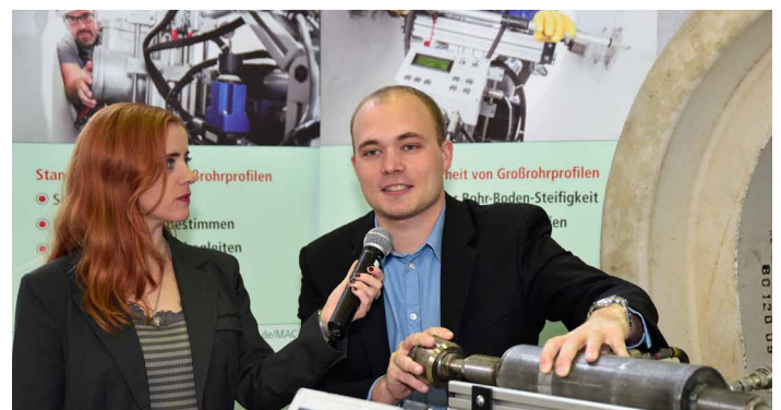
Ausstellerinterviews – live übertragen in den Vortragsaal

Für Projekte im Kommunalen Tiefbau werden Fragen der Sicherheit immer relevanter – bei kleinen Kanalsanierungsmaßnahmen genauso wie bei der Erneuerung von Großrohren. Mensch, Maschine, Methode, Material – Sicherheit auf Baustellen erfordert nicht nur praxisrelevantes Wissen sondern auch Management-Kenntnisse für die Vernetzung von Kommune, Dienstleister, Baufirma und Bürger.