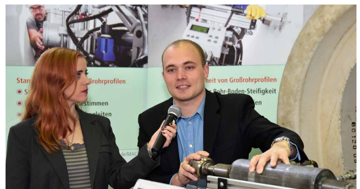
Ausstellerinterviews – live übertragen in den Vortragsaal

Für Projekte im Kommunalen Tiefbau werden Fragen der Sicherheit immer relevanter – bei kleinen Kanalsanierungsmaßnahmen genauso wie bei der Erneuerung von Großrohren. Mensch, Maschine, Methode, Material – Sicherheit auf Baustellen erfordert nicht nur praxisrelevantes Wissen sondern auch Management-Kenntnisse für die Vernetzung von Kommune, Dienstleister, Baufirma und Bürger.