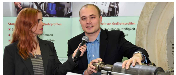
Ausstellerinterviews – live übertragen in den Vortragsaal

Die Kanalreinigung hat sich über die Jahre zu einer hochkomplexen Angelegenheit entwickelt. Der KanalReinigungsCongress – KRC 2019 vermittelt das aktuelle Wissen ganz nah an der Praxis – mit fundierten Fachvorträgen, einer großen Fachaussstellung und Ausstellerinterviews.