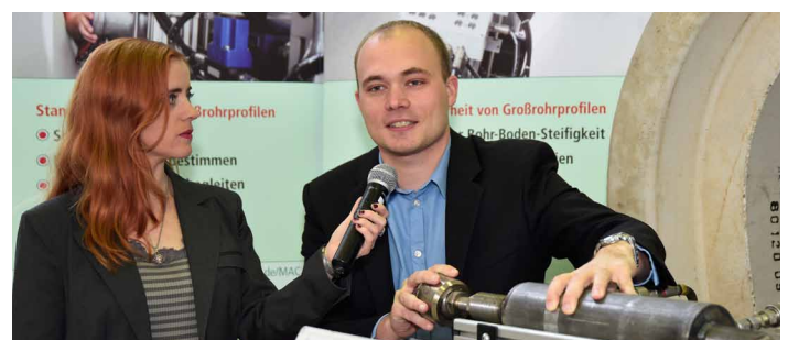
Ausstellerinterviews – live übertragen in den Vortragsaal

Beim StarkRegenCongress – SRC 2019 versammelt das IKT Wissenschaftler und Experten aus Kommunen, Ingenieurbüros und Unternehmen, um konkrete Lösungsstrategien und praktische Ansätze für Grundstückseigentümer, Kommunen und Kanalnetzbetreiber anschaulich aufzuzeigen und zu diskutieren.